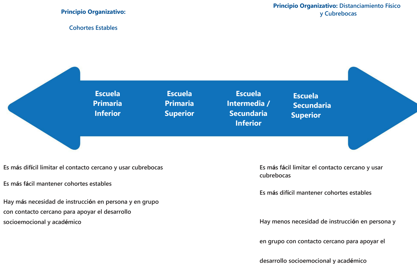
Figura 1. Principios Organizativos para Prevenir la Transmisión de COVID-19 por Grupos de Edad